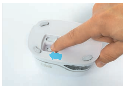
10. Включить устройство