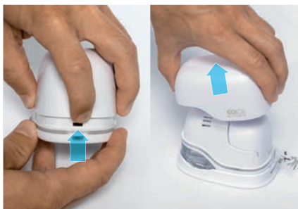
1. Снять крышку