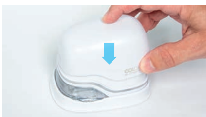
9. Закрыть крышку