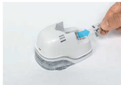
3. Снять прозрачную ленту