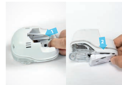
4. Открыть створчатую крышку