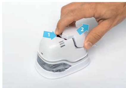
2. Достать аккумулятор