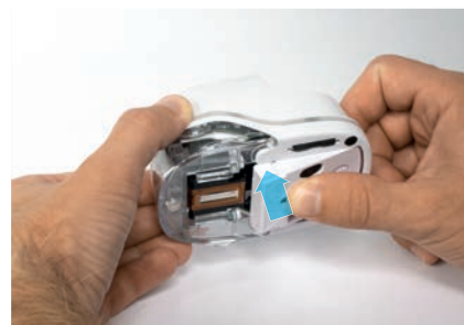
7. Закрыть створчатую крышку