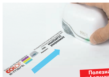
11. Напечатать тестовое изображение. Запомните номер SSID. Это номер Вашего устройства.