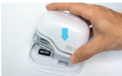
12. Поставьте устройство на док-станцию

Как подключить e-mark: https://emark.colop.com/faq/setup