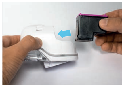
6. Вставить картридж